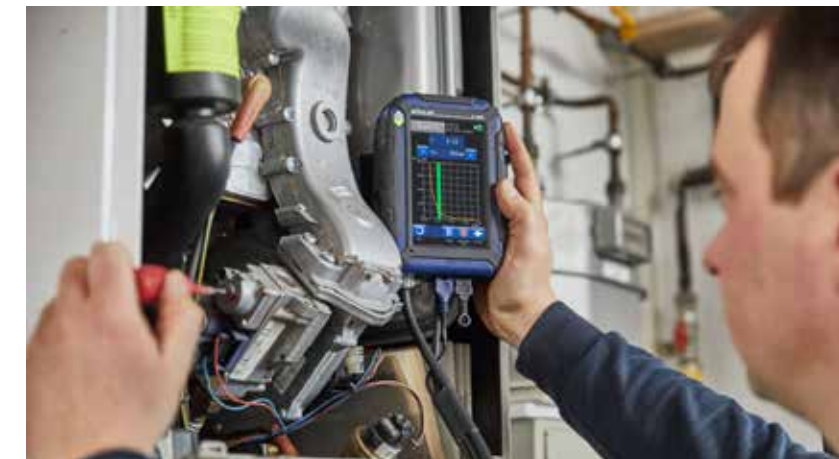
Einstellhilfe: Grafische Einstellhilfe zur schnellen und sicheren Einstellung des Lambda-Wertes.