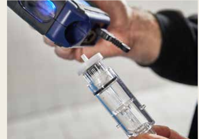
Einfache Wartung: Kondensatfalle kann zum Wechseln von Watte- und Wasserstopffilter leicht herausgezogen werden.