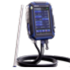
Wöhler A 450 L Abgasmessgerät 5.000 ppm CO-Sensor