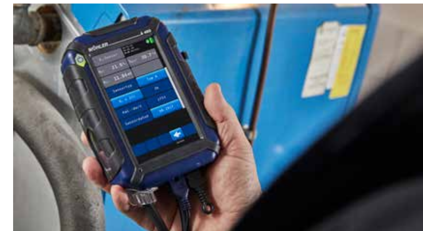
5" großer Farb-Touchscreen: Alle Mess- und Rechenwerte auf einen Blick – einfache Bedienung über Touch Display – strukturierte Menüführung.