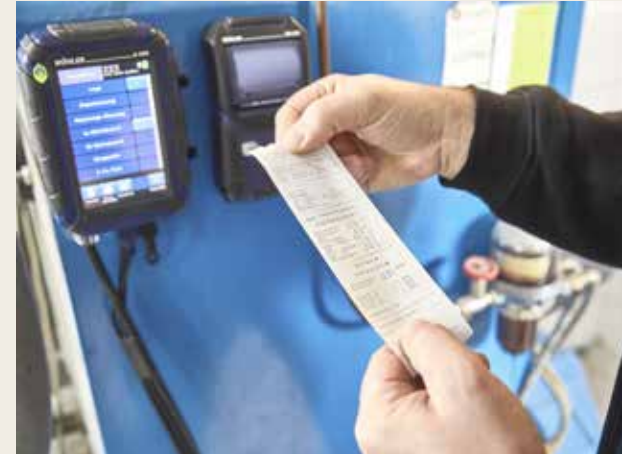
Ausdruck vor Ort: Mit dem Wöhler TD 100 Thermoschneldrucker lassen sich die Messergebnisse direkt vor Ort ausdrucken.