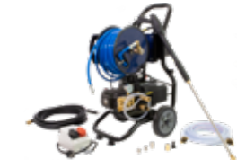
Wöhler HR 300 Hochdruckreiniger Komplett-Set