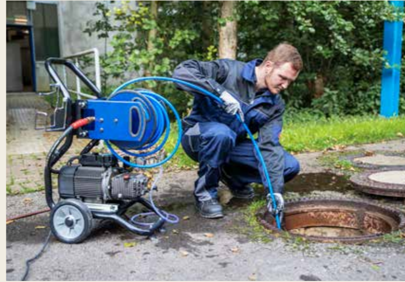
Effektive Reinigung durch extra Rohrreinigungsdüsen und langem Rohrreinigungsschlauch.