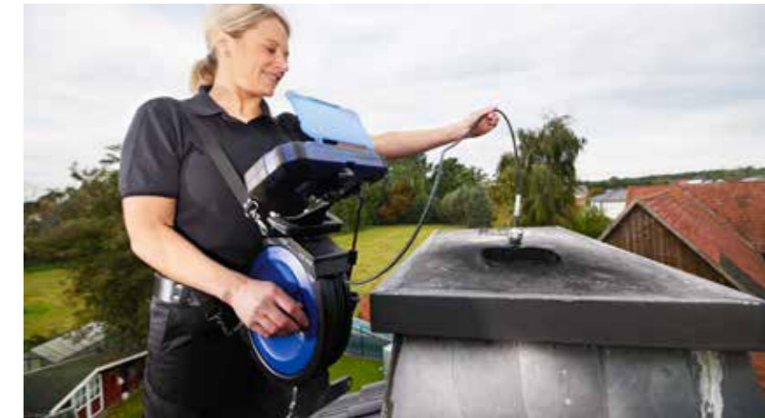
Alles dabei: Mit der Kabeltrommel kann ganz ohne Kabelsalat und mit zwei freien Händen inspiziert werden.