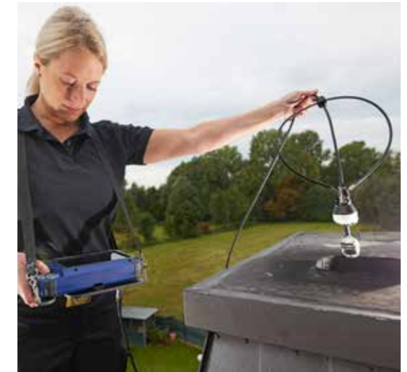
Monitor mit Kamerakabel: Ideal für die Inspektion vom Dach aus.