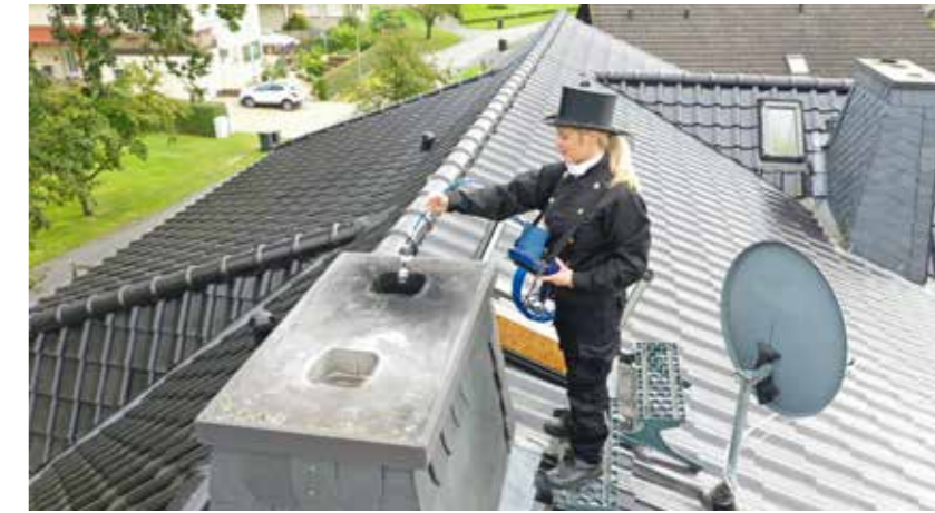
Sicherheit in jeder Position: Mit dem Tragegurtsystem bleiben beide Hände für eine sichere Inspektion vom Dach aus frei.