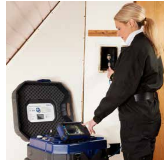
Monitor in Kofferkamera: Koffer auf – Kamera an – loslegen. Praktischer geht es nicht.