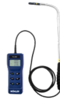
Wöhler TA 200 Thermoanemometer