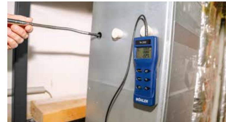
Netzmessung gemäß DIN EN 16244