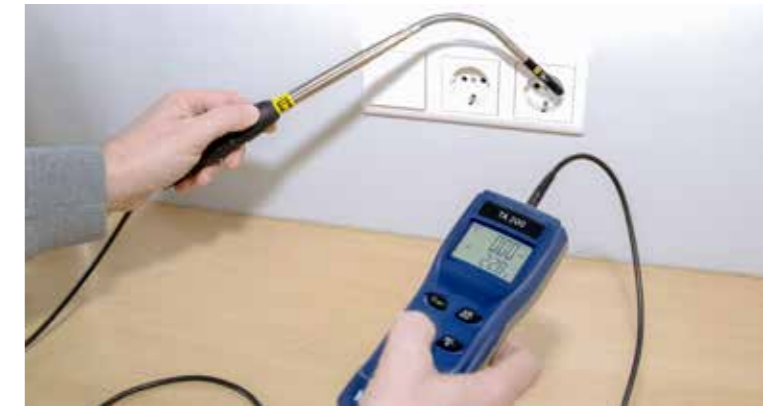
Leckageortung im Rahmen der Luftdichtheitsmessung