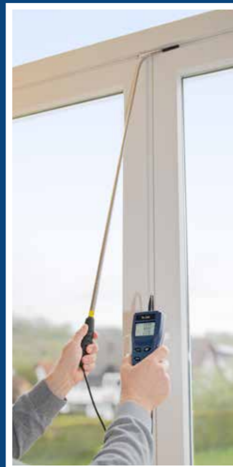
Flexibler Schwanenhals ermöglicht Leckageortung an Fenster- sowie Türrahmen, Steckdosen etc.