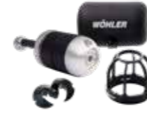
Wöhler SI 400 Smarte Inspektionskamera