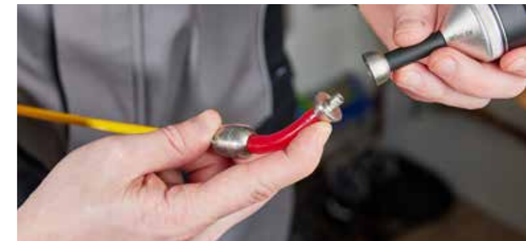
Die Wöhler SI 400 Smarte Inspektionskamera passt auf alle Wöhler Haspeln mit M5- oder M10 Gewinde (mit Adapter)