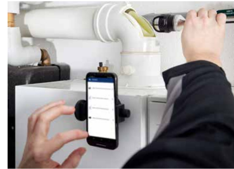
Schnell einsatzbereit: Für die Überprüfung brauchst Du nur die Wöhler SI 400 Smarte Inspektionskamera, eine passende Haspel und Dein Handy