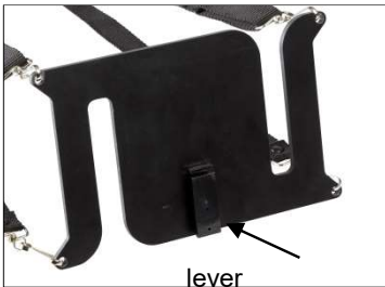
Fig. 5: Plate with lever