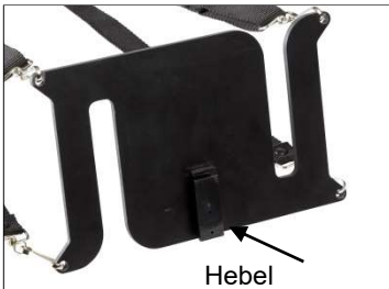
Abb. 2: Platte des Tragegurtsystems mit Monitorrasthebel