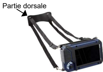
Fig. 9: Ecran fixé au système à sangles