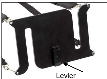
Fig. 8: Plaque avec levier