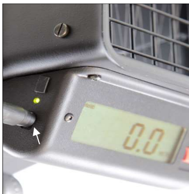
Abb. 3: Ladegerät im Ladeanschluss eingesteckt

Fällt die Spannung unter 3,4 V, erscheint ein Batteriesymbol im Display. Das Messgerät misst dann ca. 10 Minuten lang. Bei einer Batteriespannung unter 2,75 V schaltet es automatisch ab.