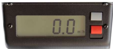
Abb. 2: Display und Kippschalter