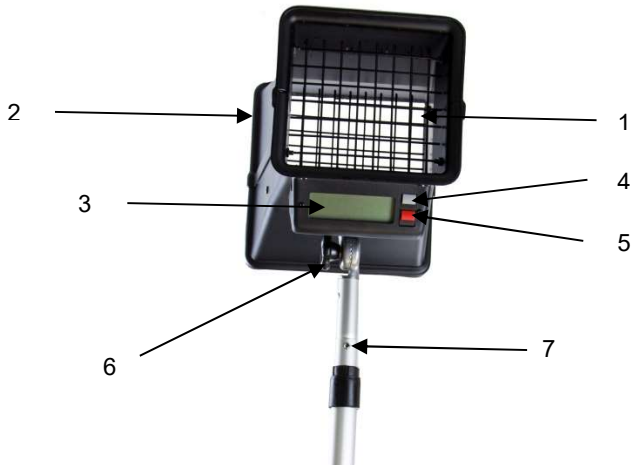
Abb. 1: Geräteteile SWF 236