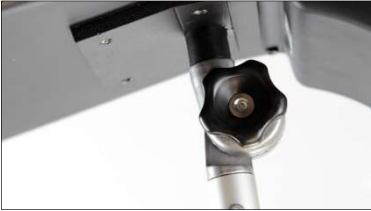
Abb. 4: Sternschraube zum Einstellen des Winkels der Teleskopstange