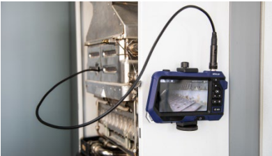
Fig. 5: Endoscope fixed to the wall

You have two options for fixing the endoscope on a magnetic surface: