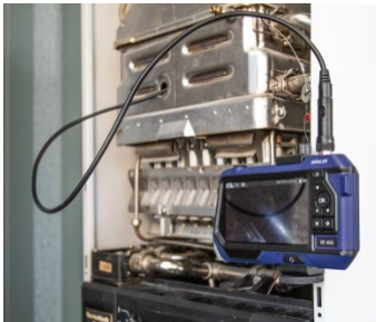
Abb. 7: Endoskop auf Fläche gestellt und mit Magnet fixiert