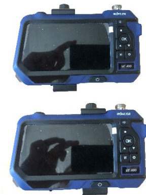
Fig. 4: Holder in correct position