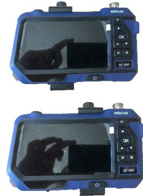
Abb. 5: Halterung korrekt positioniert