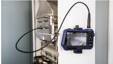
Abb. 6: Endoskop an Wand befestigt

Sie haben zwei Möglichkeiten der Befestigung des Endoskops auf einer magnetischen Fläche.