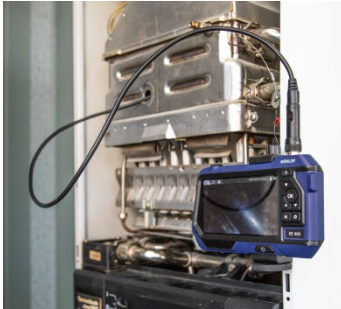
Fig. 5: Endoscope fixed on a magnetic surface