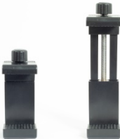
Fig. 3: Pull the holder apart