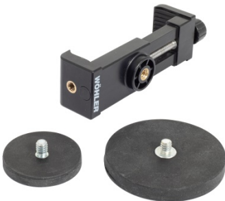
Abb. 1: Endoskop-Halterung mit 2 Magneten