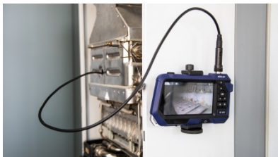
Fig. 4: Endoscope fixed to the wall

You have two options for fixing the endoscope on a magnetic surface: