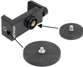
Fig. 2. Fixing the magnets to the holder