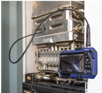
Abb. 6: Endoskop auf Fläche gestellt und mit Magnet fixiert