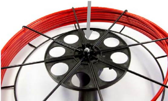
Sternehalter mit Pfeil markiert Star Holder marked by an arrow