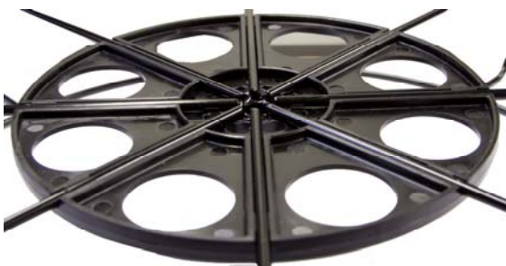
Haspelkorb ohne Sternehalter Cage without star holder

Place the pliers at the lowest point of the pin